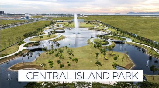
CENTRAL ISLAND PARK