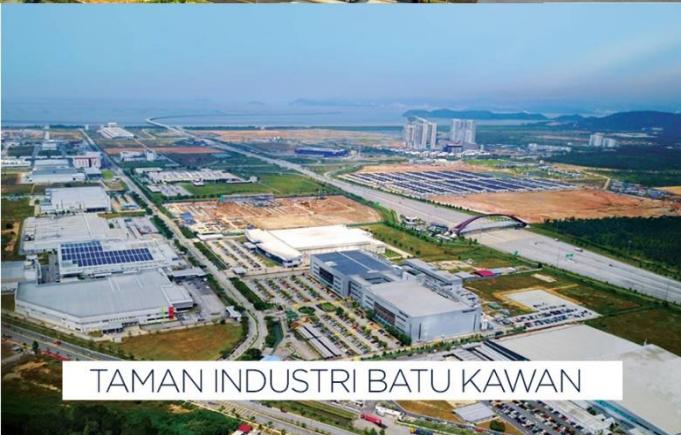
TAMAN INDUSTRI BATU KAWAN