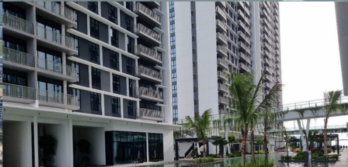
PENGINAPAN LUAR KAMPUS DI VERTU RESORT ATAU PANGSAPURI BERHAMPIRAN

*UOWM KDUPG tidak menyediakan penginapan di dalam kampus